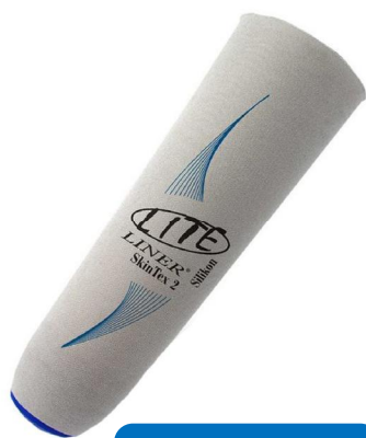
SKIN TEX 2 SIN PIN Sin refuerzo Matrix