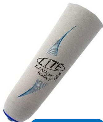
SKIN TEX 2 CON PIN Con refuerzo Matrix de 10 cm para absorción de impactos