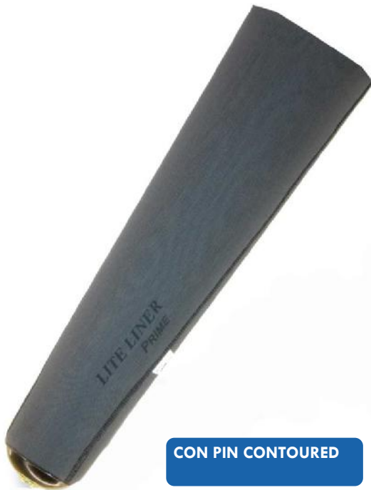
CON PIN CONTOURED