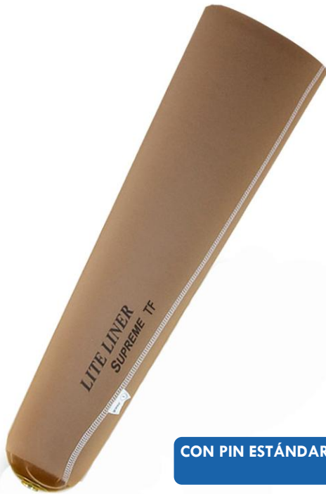
CON PIN ESTÁNDAR