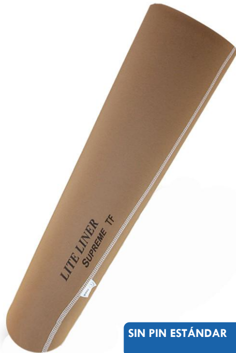
SIN PIN ESTÁNDAR